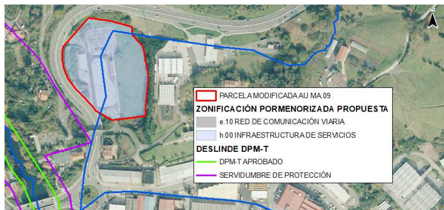
Ilustración 2.- Zonificación pormenorizada de la parcela AU MA.09, red hidrográfica y deslinde DPM-T.

Se pretende construir una edificación de tipo administrativo en el suelo liberado tras la compactación de la subestación y 1.500 m 2 de aparcamiento en superficie. La edificación contaría con tres plantas sobre rasante para oficinas y servicios [4.500 m 2 (t)], y una planta bajo rasante para almacén y aparcamientos [1.500 m 2 (t)].