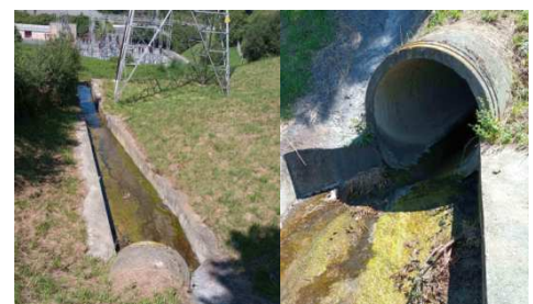
Ilustración 3.- Imágenes del tramo a cielo abierto de la regata aguas arriba de la subestación de Martutene.

De acuerdo con un análisis realizado in situ por personal de esta Agencia, la citada regata es considerada como DPH con sus correspondientes zonas de servidumbre y policía asociadas, también en su tramo soterrado.