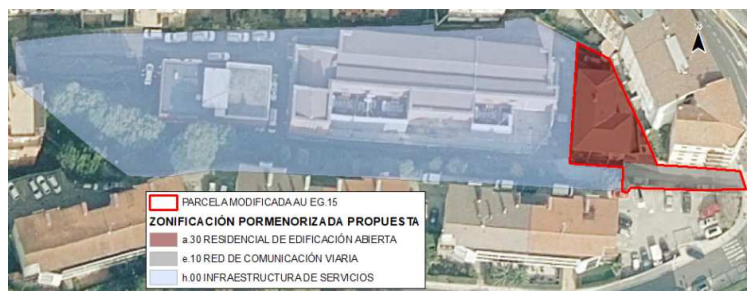
Ilustración 1.- Zonificación pormenorizada propuesta en la parcela AU EG.15.

Boulevard eraikina / Edificio Boulevard Gamarrako Atea / Portal de Gamarra 1A - 11 01013 Vitoria-Gasteiz (Araba/Álava) T: 945 01 17 00 – www.uragentzia.eus